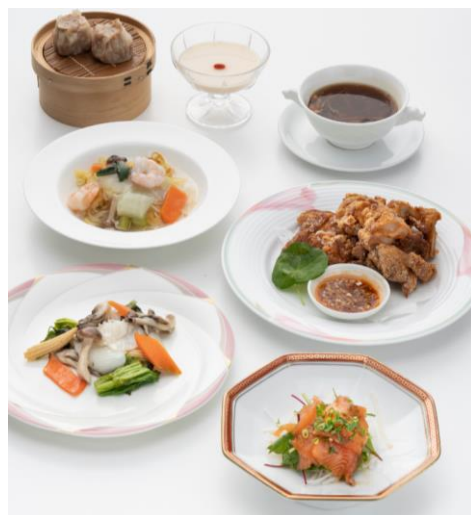
【左：中国料理「美麗華」内観 右：ディナーコース料理】